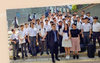
管樂團於香港聯校音樂協會主辦的聯校音樂比賽決賽中榮獲全場總冠軍。