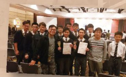
問答隊在第八屆全港學生中國國情知識大賽中取得中學組個人賽冠軍等多個獎項。

升學及就業輔導學會、聖言先鋒、聖言電台、聖言電視台、童軍、社區服務組、公益少年團、學生會、四社、聖言校報、舞台管理組、體育委員會