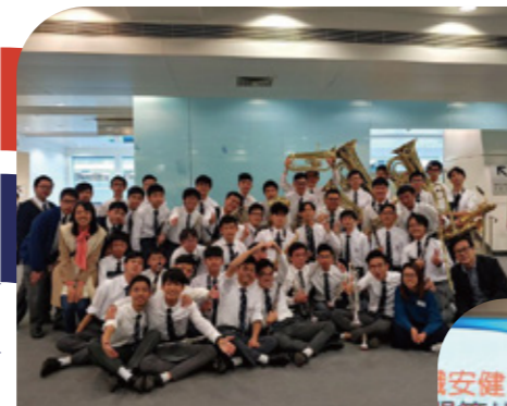
2019香港青年音樂匯演中學中級組金獎