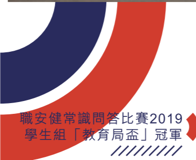
職安健常識問答比賽2019學生組「教育局盃」冠軍