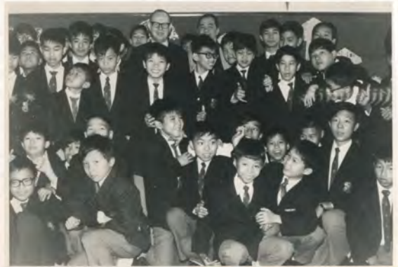
• 參與學生聖誕派對

甘神父曾經說過，起初他的意願是做教區牧民工作，後來在服從修會的指派下，展開他從沒想過的教育事業。他於1970年創立了聖言中學，立意為基層家庭子弟提供優良的教育，並且本著天主教的大愛精神，提供全人教育，培養學生完整人格，促進學生德、智、體、羣、美、靈六育的發展。神父很愛護學生，一切以學生福祉為依歸。其中最廣為人稱道的就是在學校開放溫習室。神父知道很多學生家境清貧，家居地方淺窄，有礙溫習，於是特意為學生開放課室至晚上十時，好讓他們安心溫習。另外，為了讓學生在課餘期間，接觸更多的學習領域，學校開辦了各式各樣的學會，學生不單可以擴闊視野，而且所有學會包括學生會，多由學生自治，培養他們獨立自主的精神。神父從來不會放棄任何一個學生，尤其是頑劣的學生，只採用恩威並施的方法，給予他們改過的機會。學校就像一個傳遞愛的港灣，學生可以在包容和鼓勵中成長。