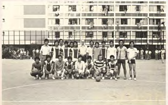
• 水庫球場上的師生足球大賽