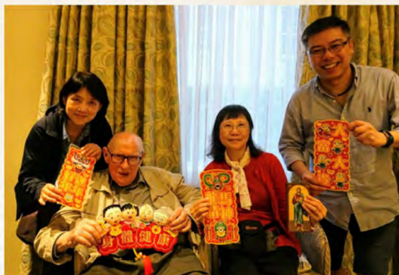
• 將所得資助轉贈他人

甘神父於1993年從聖言退休後，隨即前往澳洲任職牧民工作，其後於1996年到南非擔任本堂神父，直至到他走完人生的旅程。在南非，他依然站在貧窮者的一邊，無畏無懼的出入充滿罪惡的貧民窟，為弱勢一羣請命，讓他們得到公平的對待，他甚至把自己的所有給予有需要的人，自己恪守著神貧的精神，心甘情願過著清淡的生活。