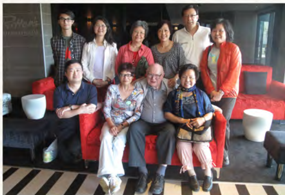
• 師生紛到南非伊利沙伯港敘舊

神父非常信任所有教職員，給老師很大的空間，可以自由發揮；另外，神父很鼓勵老師進修，而老師完成進修後，必定回來學校繼續任教，將所學的回饋學生，這方面，神父是非常有遠見的。神父亦很關心教職員的家人，每次遇見他，總會問候家人，而且記憶力驚人，家人的名字他會隨口說出。在這樣體貼的氛圍下，互相尊重，共同面對困難，老師可以安心、愉悅的工作。除了教職員，我們經常聽到工友稱讚神父很好人，事實上，雖然有時言語不通，但神父會很努力，用他的方法盡力同工友溝通。由此可見，神父待人平等，一視同仁，深受大家的敬重。