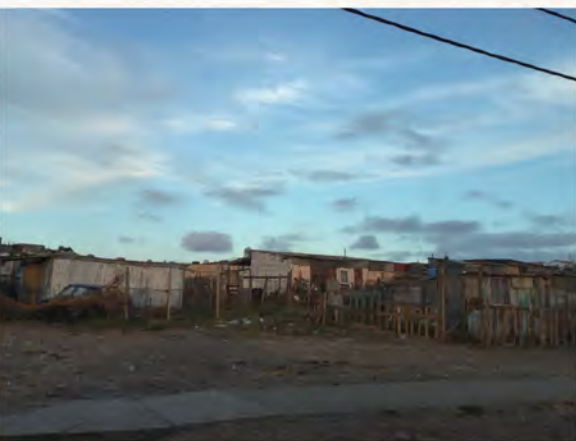
• 在南非居於貧民區